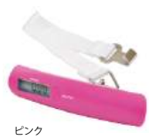
ピンク LS-101PK : 019322