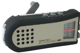
ブラック PR-318BK : 015669

機能 手回し充電※/USB充電/スマートフォン・携帯電話充電/ラジオ(ワイドFM対応)/サイレン/LEDライト/USBポート /Micro USBポート/ヘッドホンジャック/Micro USBケーブル付 意匠登録設定中 ※ハンドルを両方向に回転できますので、左利きの方でも回しやすくなっています。※1秒間に1~2回転のスピードで3分間回し続けると約30分間ラジオを聴くことができます(中音量)。LEDライトは約30分間使用できます。