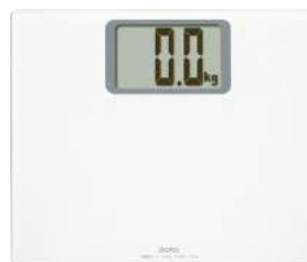
ホワイト BS-163WT : 018110