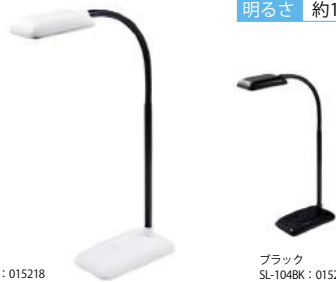
ホワイト SL-104WT : 015218