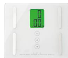
ホワイト BS-221WT : 009217