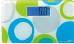
ブルー BS-162BL : 017762