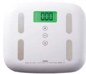
ホワイト BS-238WT : 017632