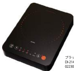
ブラック DI-214BK : 022308

機能 耐熱ガラス製トッププレート / 全面ガラスフラットタイプ / タイマー機能 / 湯沸かしモード / 炒め物モード / 設定温度調理モード / 煮込みモード / 温度過昇防止機能 / 切り忘れ防止機能 / 鍋なし検知機能 / 鍋検知機能 / 小物検知機能 / タッチセンサー / マグネットプラグ