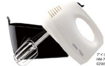
アイボリー HM-707IV : 025699

100Wのハイパワーであっという間に泡立てができます HM-707 ハンドミキサー