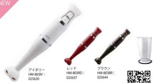
アイボリー HM-803IV : 025620 レッド HM-803RD : 025637 ブラウン HM-803BR : 025644