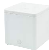
ホワイト DF-703WT : 014983

機能 超音波方式/間欠運転機能/空だき防止機能/ライトON/OFF ※エッセンシャルオイルは付属していません。