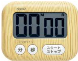
ナチュラルウッド T-554NW: 022964