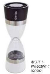
ホワイト PM-203WT : 020502

フタ付だからキッチンを汚しません！ PM-203 ソルト&ペッパーミル (手動式)