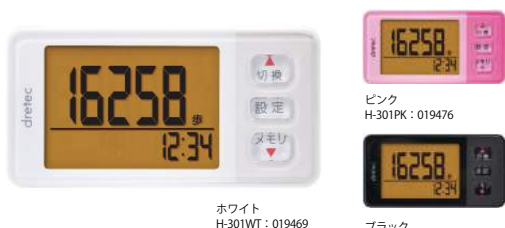
ホワイト H-301WT : 019469

※10歩以上の連続的な歩行のみをカウントします 意匠登録番号 第1430842号