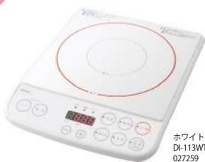
ホワイト DI-113WT : 027259