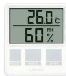
ホワイト O-214WT : 005158

機能 大画面 81×64mm / 温度の最高・最低自動メモリー / 湿度の最高・最低自動メモリー / 壁掛け用フック穴 / 立てかけスタンド