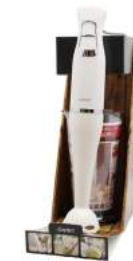
ブレンダー専用小什器