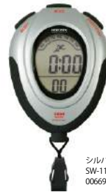
シルバー SW-114SV : 006698

機能 1/100秒ストップウォッチ/スプリットタイム計測機能/時計機能/ カレンダー表示/アラーム機能/時報/ネックストラップ付