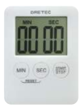
ホワイト T-307WT : 009064