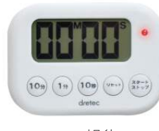
ホワイト T-528WT: 020526