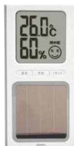
ホワイト O-254WT : 019025