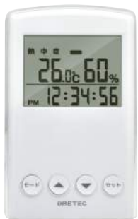
ホワイト O-242WT : 015799

機能 熱中症警告4段階/インフルエンザ警告2段階/大画面 63×63mm/ 電源スイッチ/立てかけスタンド/壁掛け用フック穴