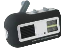
ブラック PR-319BK : 015690

※1秒間に1~2回転のスピードで3分間回し続けると約20分間ラジオを聴くことができます(中音量)。LEDライトは約30分間使用できます。※iPhoneには充電できません。