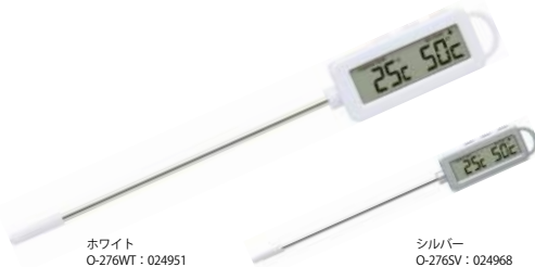
ホワイト O-276WT : 024951