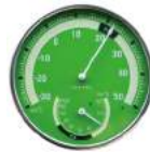
グリーン O-310GN : 008692