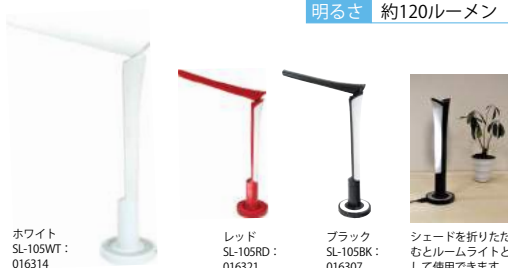
ホワイト SL-105WT : 016314