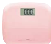
ピンク BS-157PK2 : 021721