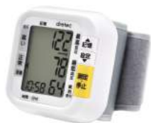
ホワイト BM-100WT : 015942