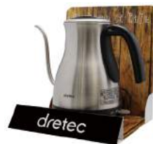
電気ケトル/ハンドミキサー