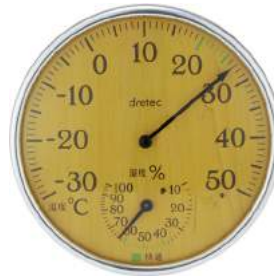
ナチュラルウッド O-319NW : 024401

機能 快適度5段階/大画面72×61mm/温度の最高・最低自動メモリー/ 湿度の最高・最低自動メモリー/立てかけスタンド/壁掛け用フック穴