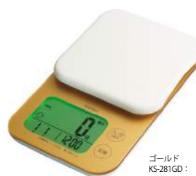
ゴールド KS-281GD : 024388