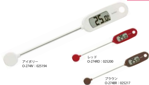
アイボリー O-274V : 025194