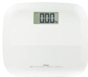
ホワイト BS-157WT2 : 021714