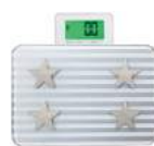
シルバー BS-242SV : 020182