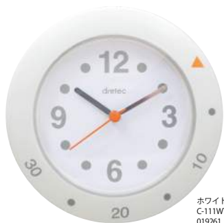
ホワイト C-111WT : 019261

サイズ：W101×D45×H107mm 電源：単3形乾電池×1個 材質：ABS樹脂、ノンフタル酸PVC 内箱入数：10 外箱入数：40 機能 防滴PX2/吸盤付/立てかけ脚付