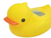
イエロー O-238NYE : 018776