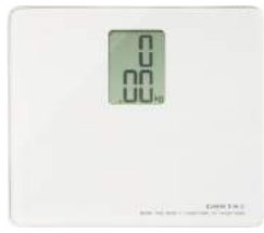
ホワイト BS-113WT : 008500