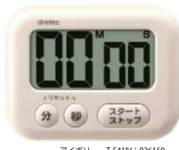
アイボリー T-541IV: 026160