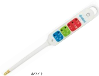
ホワイト EN-900WT : 020175

サイズ: W34×D16×H180mm 電源: リチウム電池 CR2032×1個 材質: ABS樹脂、ポリプロピレン、真鍮(金メッキ処理) 内箱入数: 10 外箱入数: 120 機能: 防水IPX7 / 測定結果デジタル表示 / 塩分濃度測定範囲 0.1~5.0% / オートパワーオフ 意匠登録番号 第1580570号