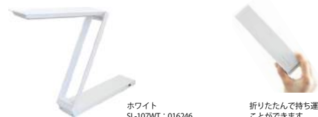
ホワイト SL-107WT : 016246