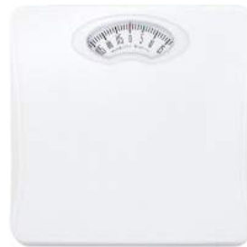
ホワイト BS-302WT : 008067