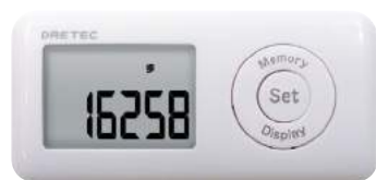
ミント H-231WT : 013641

※10歩以上の連続的な歩行のみをカウントします 意匠登録番号 第1575178号