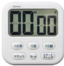
ホワイト T-542WT: 021912