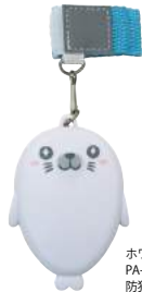
ホワイト PA-114WT : 010886 防犯アラーム「たま坊」

※ハンドルを両方向に回転できますので、左利きの方でも回しやすくなっています。※1秒間に1~2回転のスピードで3分間回し続けると約30分間ラジオを聴くことができます(中音量)。LEDライトは約30分間使用できます。※iPhoneには充電できません。