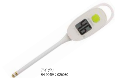
アイボリー EN-904W : 026030