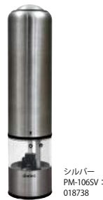
シルバー PM-106SV : 018738