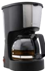
ブラック CM-100BK : 027150

旨みをしっかり抽出シャワードリップ CM-100 コーヒーメーカー「リラカフェ」