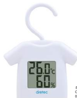
ホワイト O-279WT : 025873