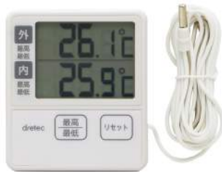
アイボリー O-285IV : 026580