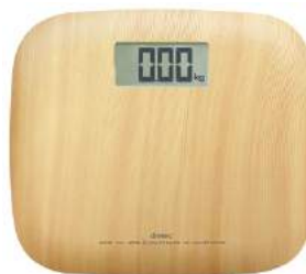
ナチュラルウッド BS-171NW : 021684