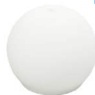
ホワイト DF-706WT : 020687

機能 超音波方式/間欠運転機能/空だき防止機能 ※エッセンシャルオイルは付属していません。