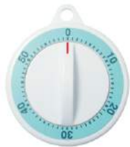
ブルー T-331BL : 021974