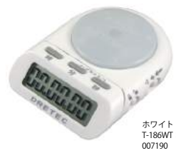
ホワイト T-186WT : 007190