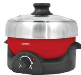
レッド MC-805RD : 023107

機能 耐熱ガラス製トッププレート / 全面ガラスフラットタイプ / 定温調理モード / 加熱モード / 温度過昇防止機能 / 切り忘れ防止機能 / 鍋なし検知機能 / 鍋検知機能 / 小物検知機能 / タッチセンサー / マグネットプラグ