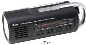
ブラック PR-321BK : 025231