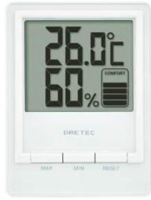
ホワイト O-233WT : 013122