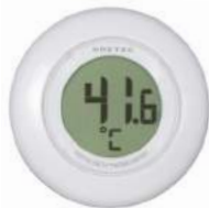
ホワイト O-227WT : 009910

サイズ：W130×D50×H110mm 電源：単3形乾電池×3個(電池別売) 材質：ABS樹脂 内箱入数：12 外箱入数：24 機能 防滴PX2/AM/FMラジオ/ワイドFM対応/壁掛け用フック/立てかけスタンド