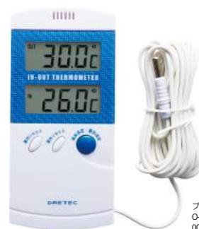
ブルー O-209BL : 002638

機能 室内外温度同時表示 / 温度の最高・最低自動メモリー / 壁掛け用フック穴 / 磁石×1個 / 立てかけスタンド