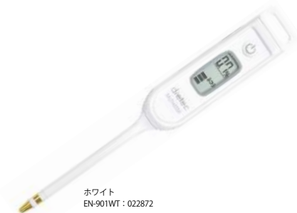
ホワイト EN-901WT : 022872