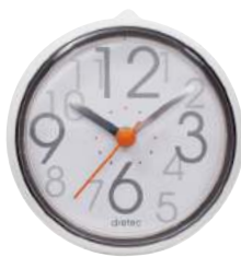
ホワイト C-110WT2 : 019803