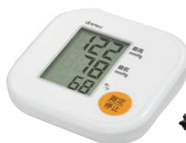
ホワイト BM-201WT : 020632

意匠登録番号 第1470860号、医療機器認証番号 224AKBZX00145000