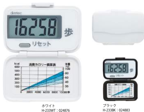
ホワイト H-233WT : 024876