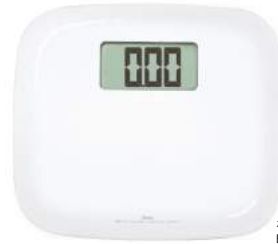
ホワイト BS-167WT : 023138