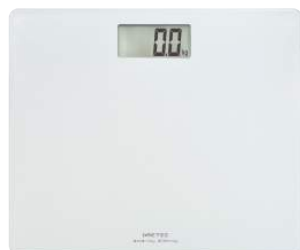
ホワイト BS-159WT : 016857