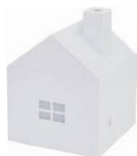
ホワイト DF-704WT : 015829

機能 超音波方式/間欠運転機能/空だき防止機能 ※エッセンシャルオイルは付属していません。