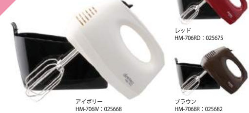
アイボリー HM-706IV : 025668