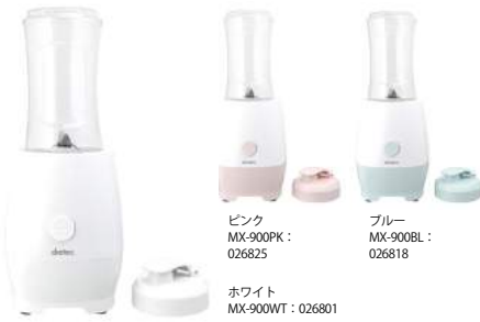
ピンク MX-900PK : 026825 ブルー MX-900BL : 026818 ホワイト MX-900WT : 026801