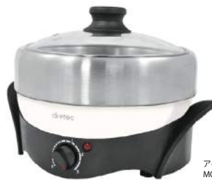
アイボリー MC-804V : 023084