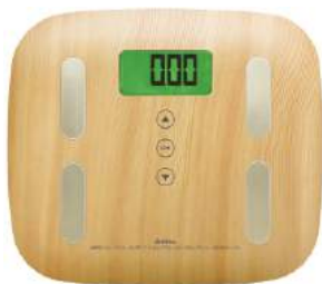
ナチュラルウッド BS-244NW : 022100

機能 体重/体脂肪率/体水分率/筋肉量/推定骨量/基礎代謝量/内臓脂肪レベル/ユーザー認識/ バックライト画面/軽量/登録人数5人/タッチセンサー/電源オートオン