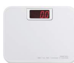
ホワイト BS-116WT : 009262