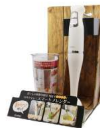
ブレンダー専用什器