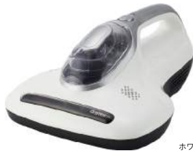
ホワイト FC-201WT : 024296