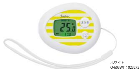
ホワイト O-603WT : 023275