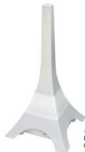
ホワイト DF-709WT : 023985

機能 超音波方式/イルミネーションライト/空だき防止機能 ※エッセンシャルオイルは付属していません。