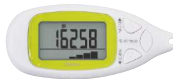
ホワイト H-302WT : 019957