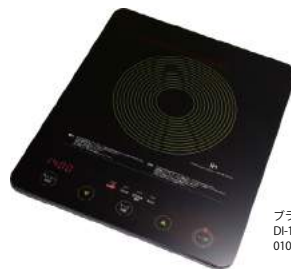
ブラック DI-106BK2 : 010848

機能 耐熱ガラス製トッププレート (BK) / 耐熱セラミック製トッププレート (WT) / タイマー機能 / 加熱モード / 揚げ物モード / 煮込みモード / 保温モード / 鍋なし検知機能 / 小物検知機能 / 温度過昇防止機能 / 切り忘れ防止機能 / チャイルドロック機能 / マグネットプラグ