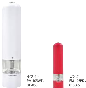
ホワイト PM-105WT : 015058