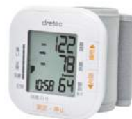
ホワイト BM-103WT : 024067