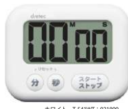
ホワイト T-541WT: 021899