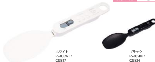
ホワイト PS-035WT : 023817