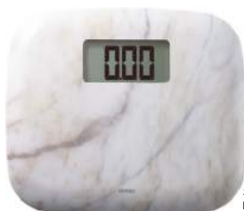
ホワイトストーン BS-173WS : 024753