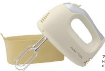
アイボリー HM-705IV : 025842