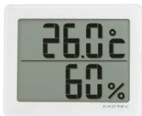
ホワイト O-226WT : 009286

機能 大画面 61×40mm / 温度の最高・最低自動メモリー / 湿度の最高・最低自動メモリー / 壁掛け用フック穴 / 立てかけスタンド / 磁石×1個