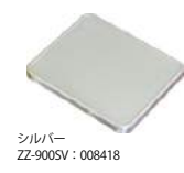
シルバー ZZ-900SV : 008418