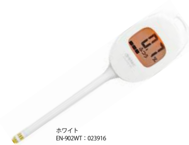
ホワイト EN-902WT : 023916

サイズ: W27×D14×H190mm 電源: リチウム電池 CR2032×1個 材質: ABS樹脂、ポリプロピレン、真鍮(金メッキ処理) 内箱入数: 10 外箱入数: 120 機能: 測定結果デジタル表示 / 濃度レベル表示 / 塩分濃度測定範囲: 0.3~1.5% / オートパワーオフ 意匠登録番号 第1552735号