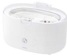
ホワイト UC-500WT : 027686