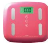
ピンク BS-238PK : 017649