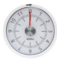
ホワイト T-319WT : 020168