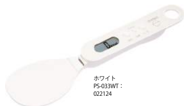
ホワイト PS-033WT : 022124