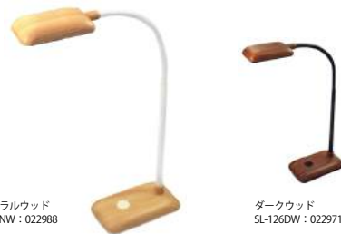
ナチュラルウッド SL-126NW : 022988