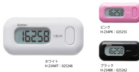
ホワイト H-234WT : 025248