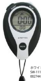
ホワイト SW-111WT : 002744