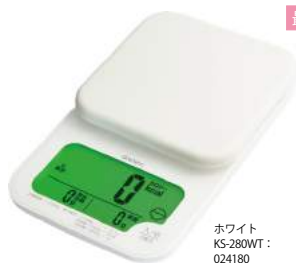
ホワイト KS-280WT : 024180