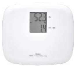
ホワイト BS-164WT : 018431