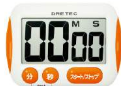
オレンジ T-291OR: 001624