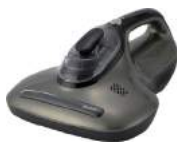
ガンメタリック FC-201GM : 024111