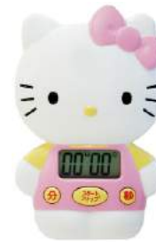
ピンク T-142PK : 002157