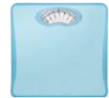
ブルー BS-302BL : 008425