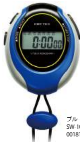
ブルー SW-109BL : 001815

機能 1/100秒ストップウォッチ/ラバーグリップ/スプリットタイム計測機能/ 時計機能/カレンダー表示/アラーム機能/時報/ネックストラップ付