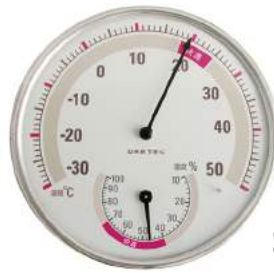
ホワイト O-310WT : 008661