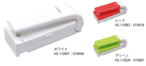
ホワイト HS-110WT : 018998