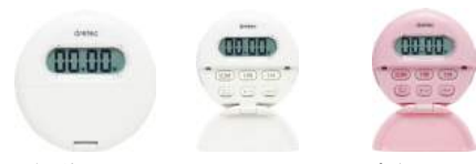
ホワイト T-558WT : 024340