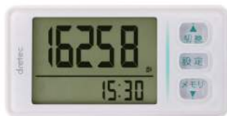
ホワイト H-236WT : 026627