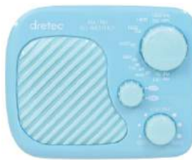
ブルー PR-320BL : 020908