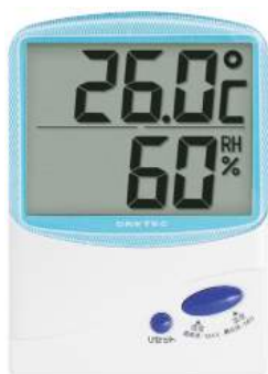
ブルー O-206BL : 001945