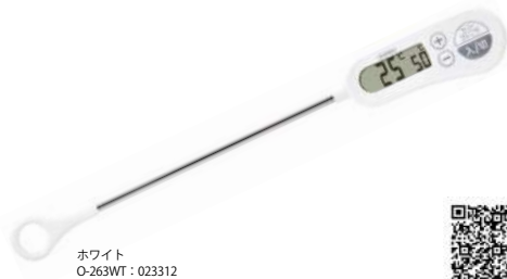
ホワイト O-263WT : 023312