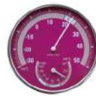
ピンク O-310PK : 008678