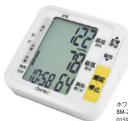
ホワイト BM-200WT : 015959