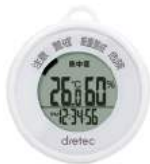
ホワイト O-244WT : 016673