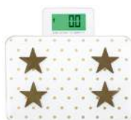
ゴールド BS-242GD : 020199

機能 体重/体脂肪率/体水分率/筋肉量/推定骨量/基礎代謝量/コンパクト/ユーザー認識/ バックライト画面/登録人数12人/タッチセンサー/前回測定結果表示