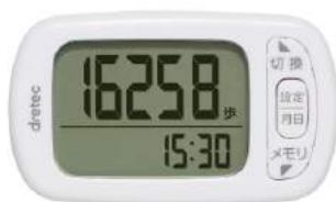
ホワイト H-235WT : 027754